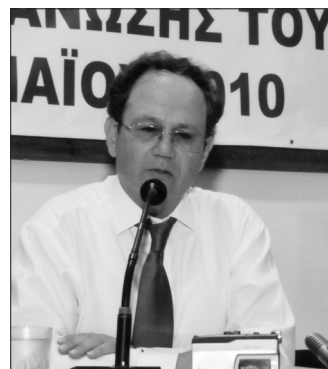
Φοίβος Κλόκκαρης, Αντιστράτηγος ε.α., πρώην Υπουργός Άμυνας